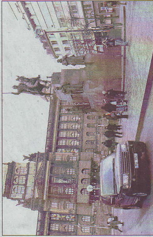
QUARANTE ANS APRÈS. Le musée national trône toujours sur la place. Le 4x4, lui, est très prisé dans l'ensemble de la ville. (LP/P. LAVIELLE)